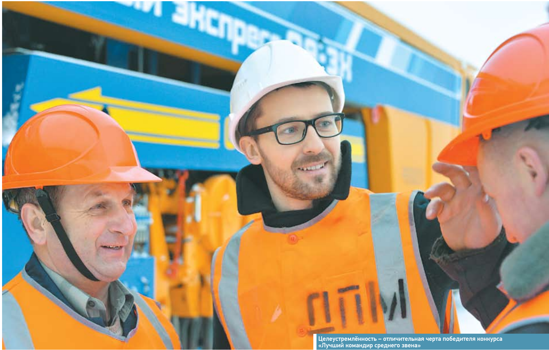
Целеустремлённость – отличительная черта победителя конкурса «Лучший командир среднего звена»