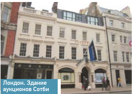
Лондон. Здание аукционов Сотби