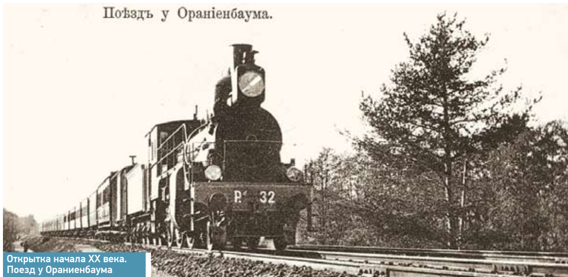
Открытие начала XX века. Поезд у Ораниенбаума

Начало линии было положено в 1907 году, когда руководство страны решило принять меры к усилению обороны столицы со стороны Балтийского моря – строительство дополнительных укреплений на северном берегу Финского залива и на южном – в районе деревни Юхимьяки (Красная Горка). Для доставки строительных материалов к форту Красная Горка взялись построить Ижорскую военную железную дорогу от Ораниенбаума. Начинаясь она от канала имени Екатерины Великой, где соорудили Спасательную станцию. К декабрю 1912 года железная дорога и первые три батареи были готовы. Кроме Спасательной имелись станции Малая и Большая Ижора, Лебяжье и Красная Горка.