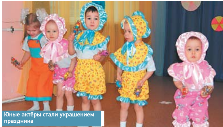
Юные актёры стали украшением праздника

НА ДНЯХ КОЛЛЕКТИВ ДОЕТСКОГО САДА № 14 ОАО «РЖД» НА СТАНЦИИ БЕЛОМОРСК ОТМЕТИЛ 30-ЛЕТИЕ ДОШКОЛЬНОГО УЧРЕЖДЕНИЯ.