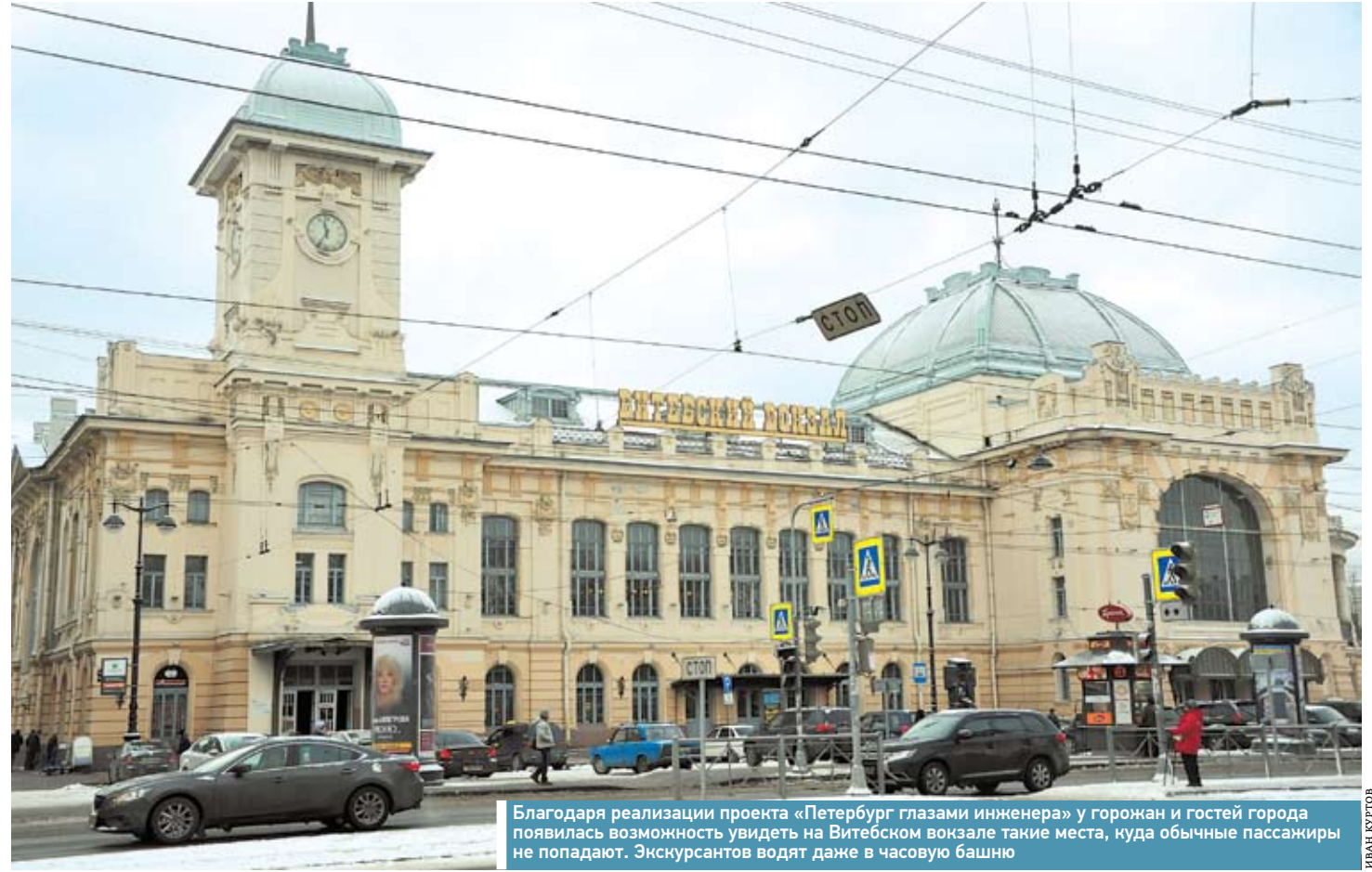
Благодаря реализации проекта «Петербург глазами инженера» у горожан и гостей города появилась возможность увидеть на Витебском вокзале такие места, куда обычные пассажиры не попадают. Экскурсантов водят даже в часовую башню

Вокзалы Северо-Запада – активные участники мероприятий городского, государственного и мирового масштаба