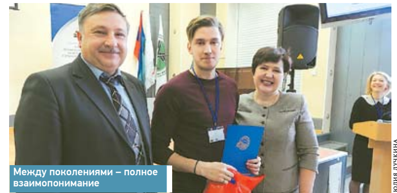
Между поколениями – полное взаимопонимание

Молодые железнодорожники из Костомукши, Медвежьегорска, Сортавалы, Кеми, Свири, Беломорска, Суоярви и Петрозаводска стали участниками семинара-тренинга.