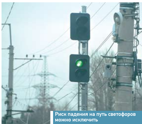
Риск падения на путь светофоров можно исключить

Более 2 млн рублей рассчитывают сэкономить в Московской дистанции сигнализации, централизации и блокировки за счёт модернизации системы интервального регулирования движения поездов. Соответствующий функциональный проект планируется реализовать в нынешнем году.