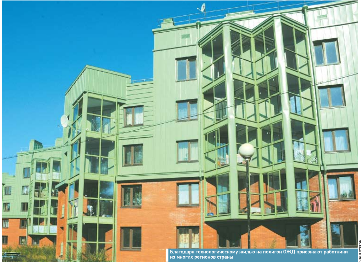
Благодаря технологическому жилью на полигон ОЖД приезжают работники из многих регионов страны

– Для состоящих на учёте по предоставлению такой поддержки работников ОЖД, а также региональных дирекций и других структурных подразделений в границах