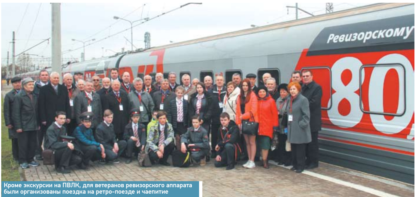
Кроме экскурсии на ПВЛК, для ветеранов ревизорского аппарата были организованы поездка на ретро-поезде и чаепитие