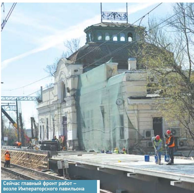
Сейчас главный фронт работ – возле Императорского павильона

Витебский вокзал готовят не только к сезону летних пассажирских перевозок, но и к празднованию в октябре 180-летия железных дорог России. Пусть тогда на его месте возвышалось другое строение, но началось ведь всё именно здесь. И построенный в 1904 году в стиле модерн Витебский (изначально Царскоесельский) вокзал сегодня – единственный в Санкт-Петербурге, бережно сохранивший первоначальный архитектурный облик и интерьеры царских времён.