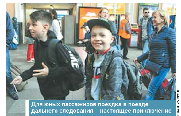
Для юных пассажиров поезда в поезде дальнего следования – настоящее приключение