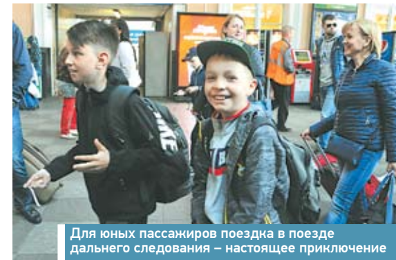
Для юных пассажиров поезда в поезде дальнего следования – настоящее приключение