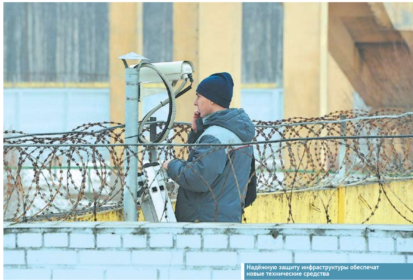
Надёжную защиту инфраструктуры обеспечат новые технические средства

Северо-Западная транспортная прокуратура проводит регулярные проверки