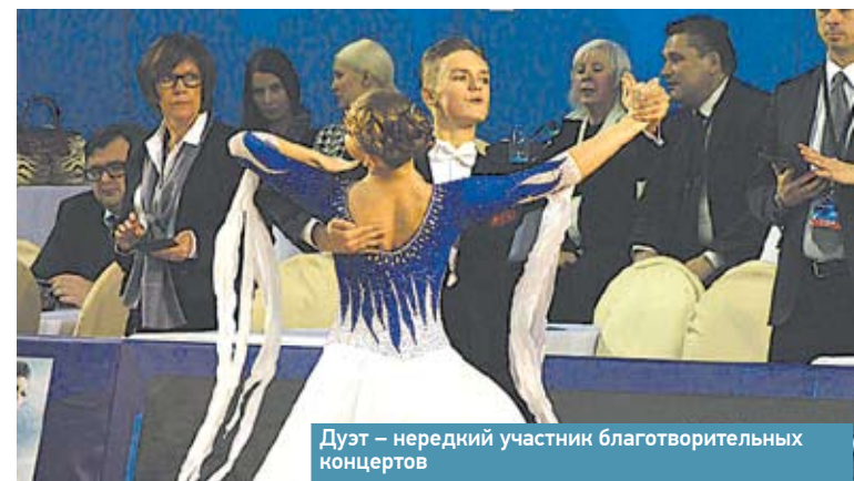
Дуэт – нередкий участник благотворительных концертов

Красивую танцевальную пару пассажиры иногда могут увидеть прямо у московских вокзалов. Молодые люди своим искусством привлекают множество зрителей.