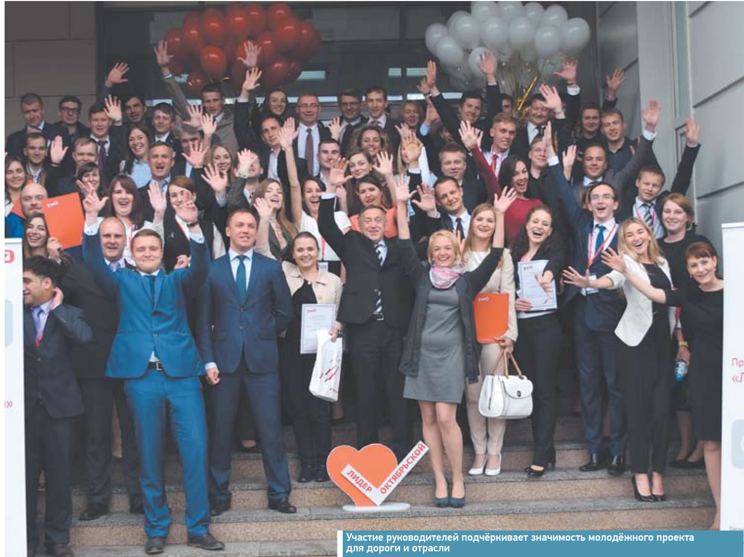
Участие руководителей подчёркивает значимость молодёжного проекта для дороги и отрасли

На третьем месте – проект «РЖД-Интегратор» молодых специалистов юридической службы. Они предлагают создать единую коллегиальную международную организацию, наделённую исключительными полномочиями по разрешению