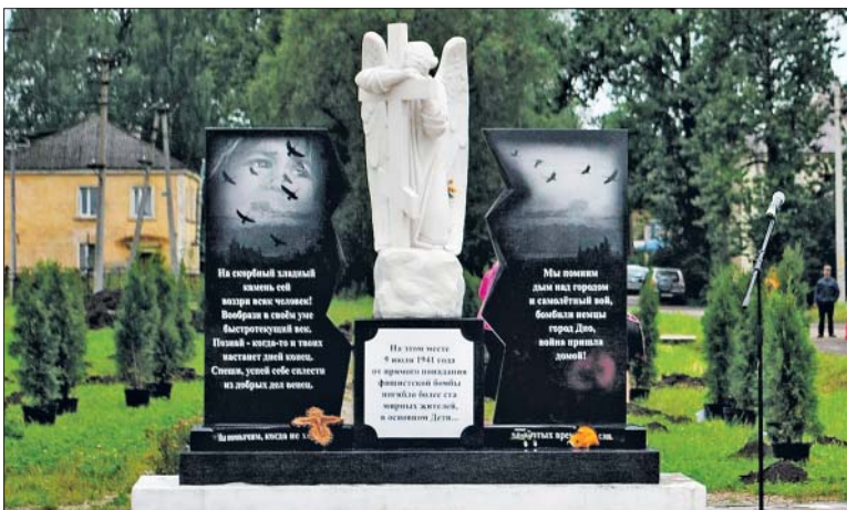
Мемориал «Скорбящий ангел»