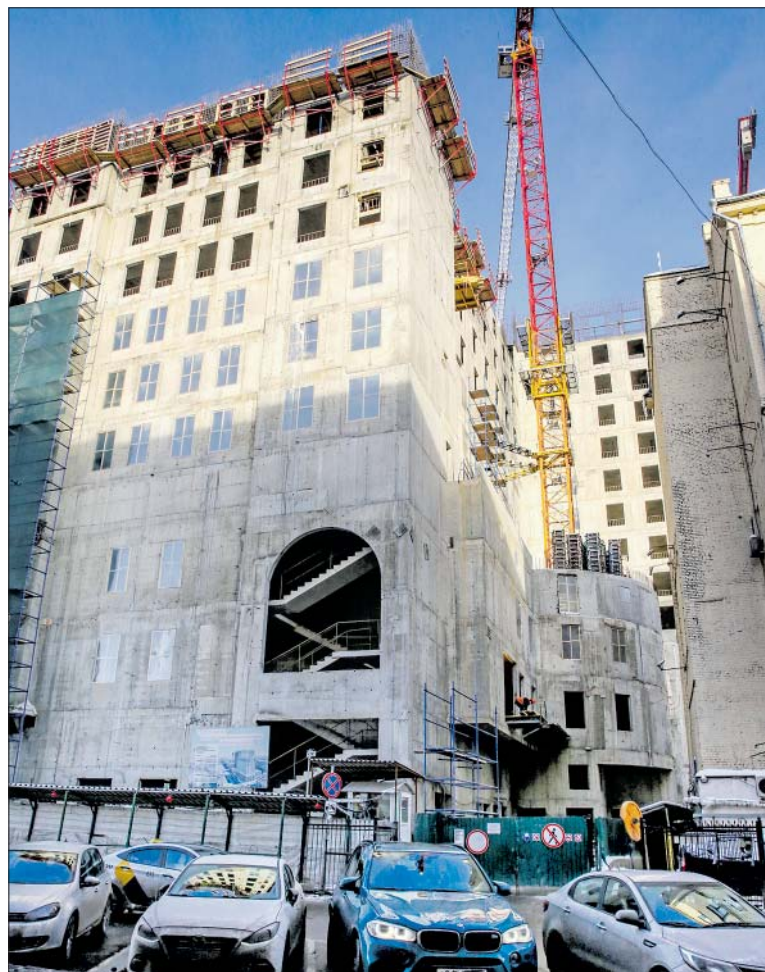
Дом строится. Квартиры продаются.

три: Сбербанк, Газпромбанк и Россельхозбанк. Сейчас к ним прибавились банки «Россия» и «Санкт-Петербург», Совкомбанк, ВТБ, Альфа-банк, Российский национальный коммерческий банк, Связь-банк, «Пересвет», Росбанк, «Российский капитал», Новикомбанк, БМ-банк, Фондсервисбанк, Росевробанк, Всероссийский банк развития регионов.