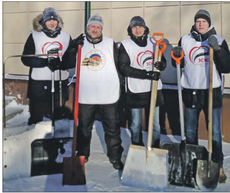
Активисты волонтерского отряда ЗСЖД организовали 20 января акцию по уборке снега на территории детского сада №163 ОАО «РЖД»

На сети РЖД немало добровольческих объединений, счёт идёт на сотни. И между тем каждое из них индивидуально.