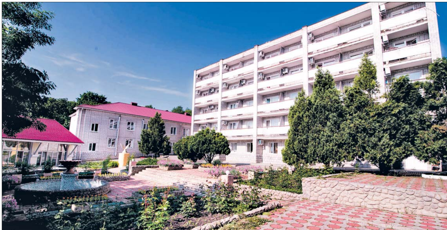
«Долина Нарзанов» под Железноводском в ожидании отдыхающих