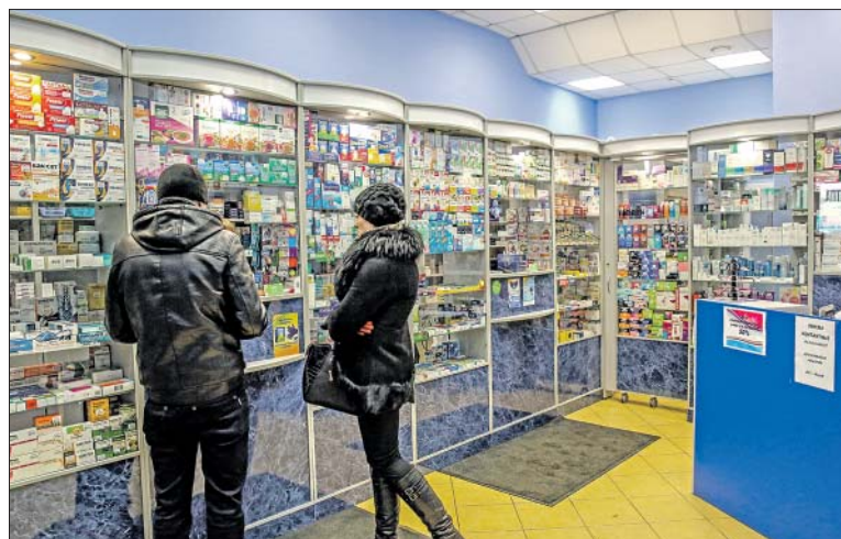
Эффективное лекарство не обязательно самое дорогое

Например, при отсутствии «Нурофена Форте» в аптеках можно купить «Ибурофен-Хемофарм». Лекарства эти