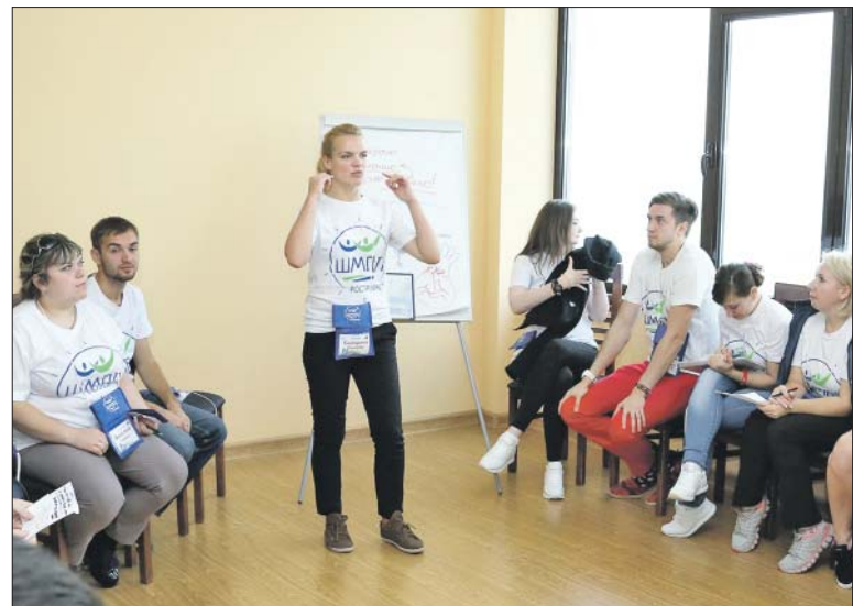
Школа по-прежнему будет проходить в три этапа

сайте РОСПРОФЖЕЛ в разделе «Молодёжный совет», на сайтах Дорпрофжел, а также на наших страницах в социальных сетях: ВКонтакте, Instagram, Телеграм, и конечно, вся актуальная информация о первом и втором этапе есть у молодёжных советов Дорпрофжел и Терпрофжел.