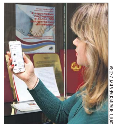
Сегодня гаджеты полезны и для работы