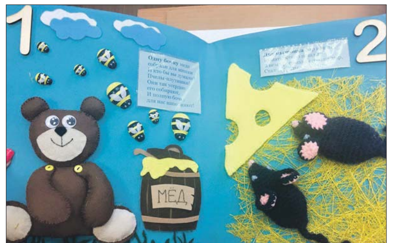
Тактильная книга, созданная волонтерами Приволжской дороги